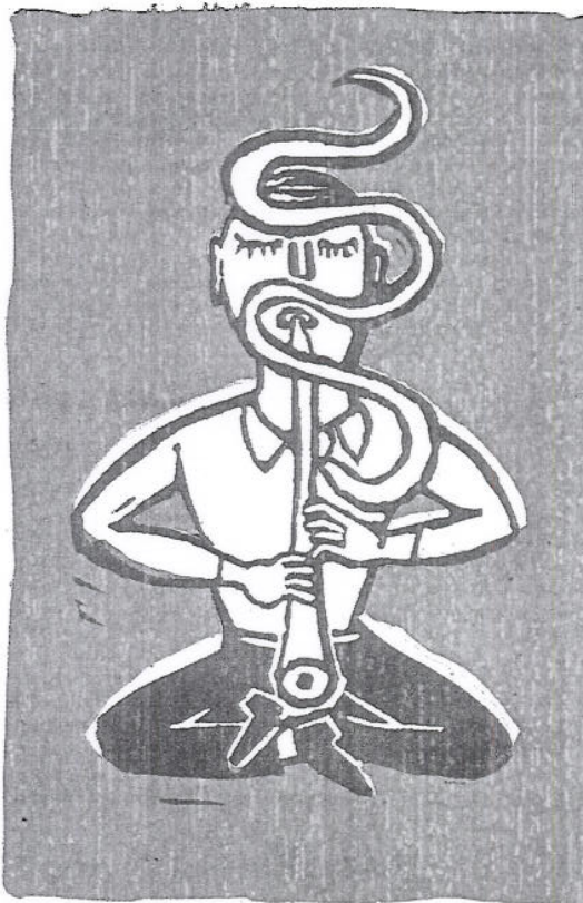
Illustratie Olivia Ettema